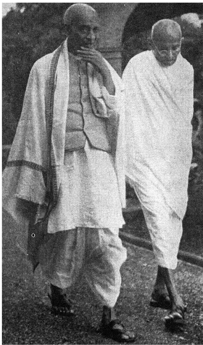
बापू और सरदार